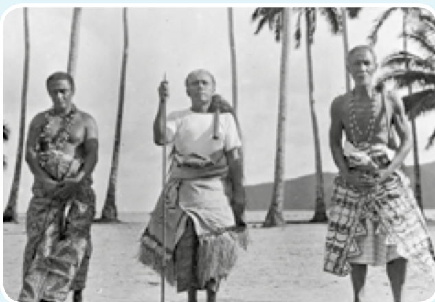
3 chefs samoans - Photo libre de droits CC BY-SA 3.0

Les îles Samoa sont des îles polynésiennes du pacifique. Outre le cercle décrit ici, elles sont connues pour leurs paysages paradisiaques, les tatouages de ses habitants et leur talent au rugby.